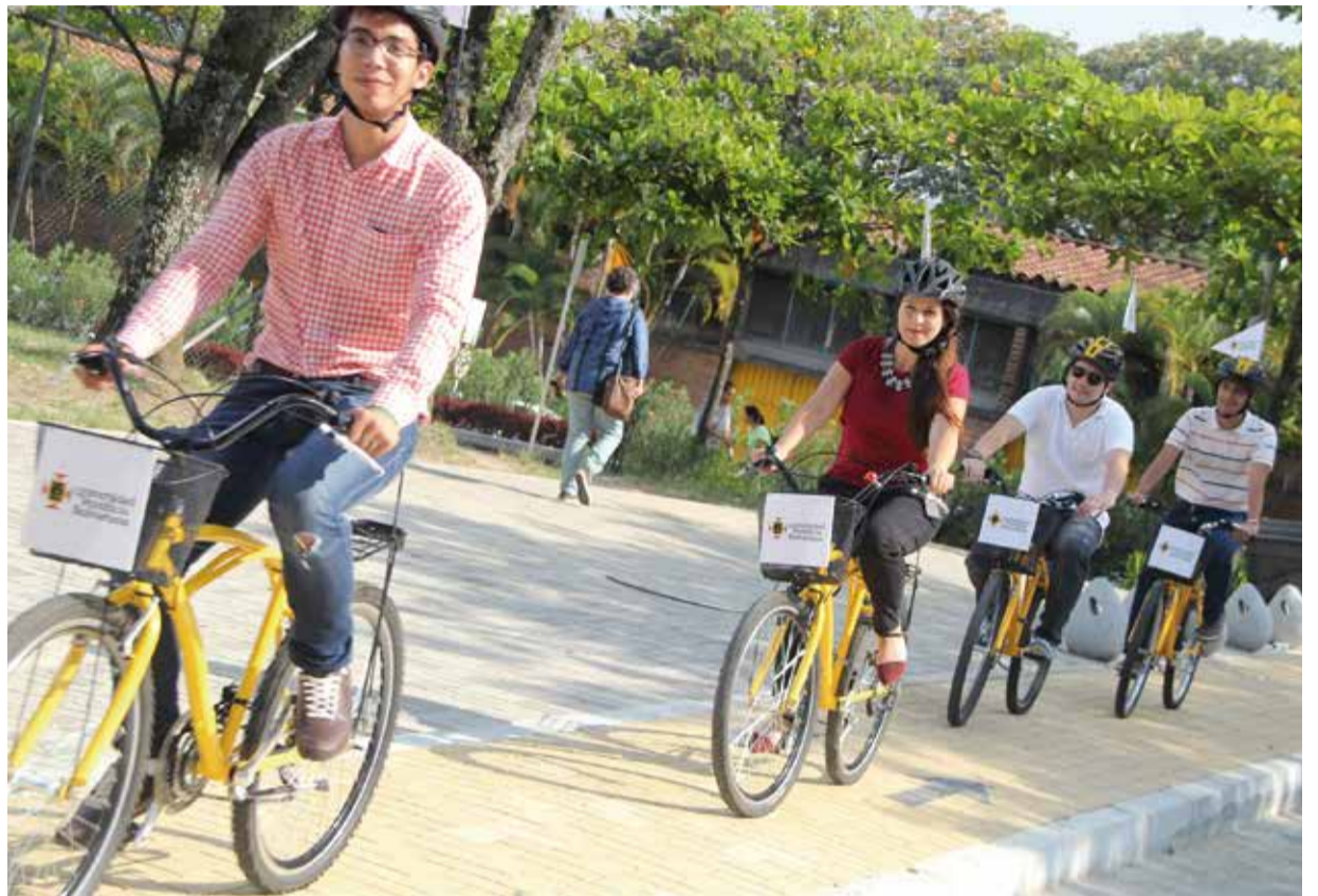
La UPB inauguró sus nuevas bicivías o ciclorrutas internas. La Universidad acondicionó 1.217 metros de una red en adoquín y pintura sobre asfalto para la circulación de estudiantes, docentes y empleados que se movilizan en bicicleta por la ciudad y que llegan al campus de Laureles. Próximamente se acondicionarán nuevos biciparqueaderos, entre ellos, uno que quedará en la Universidad como legado del Foro Mundial de la Bicicleta.

La Universidad Pontificia Bolivariana ha creído en la bicicleta como una opción sostenible en temas de movilidad, como factor incluyente y referente del esfuerzo personal y del bienestar común. La UPB ha pedaleado en torno a encuentros académicos de alcance mundial, reflexiones sobre la incursión de la bicicleta en las dinámicas de ciudad y adecuaciones internas de bicivías y biciparqueaderos. Con la iniciativa del Instituto de Estudios Metropolitanos y Regionales y la Facultad de Diseño Industrial, la Universidad se ha montado en la aventura de la bicicleta.