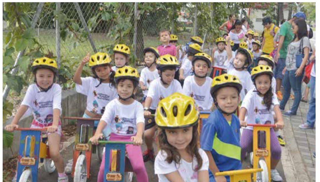
Niños de Laureles participaron en una actividad donde pintaron y decoraron sus nuevas bicicletas de balance, fabricadas en madera por estudiantes del pregrado. Estas bicicletas son de madera laminada y de balance, es decir, sin pedales y que propician que los niños se desplacen con sus piernas, empezando a tomar equilibrio. Niños de 3 a 5 años salieron a montar sus bicicletas por las bicivías de la Universidad y por las nuevas ciclorrutas del barrio Laureles