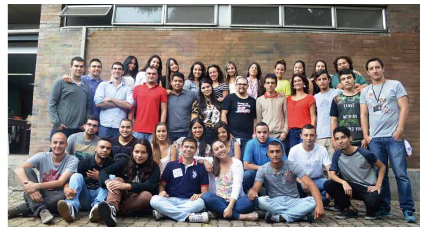
Grupo de estudiantes y docentes que hacen parte de YARUMO UPB.

El evento, creado en 2002 por el Departamento de Energía de los Estados Unidos, se realiza cada dos años y desde el 2010 se ejecuta en el ámbito internacional, siendo Europa y Asia sedes alternativas. Este año, se llevará a cabo