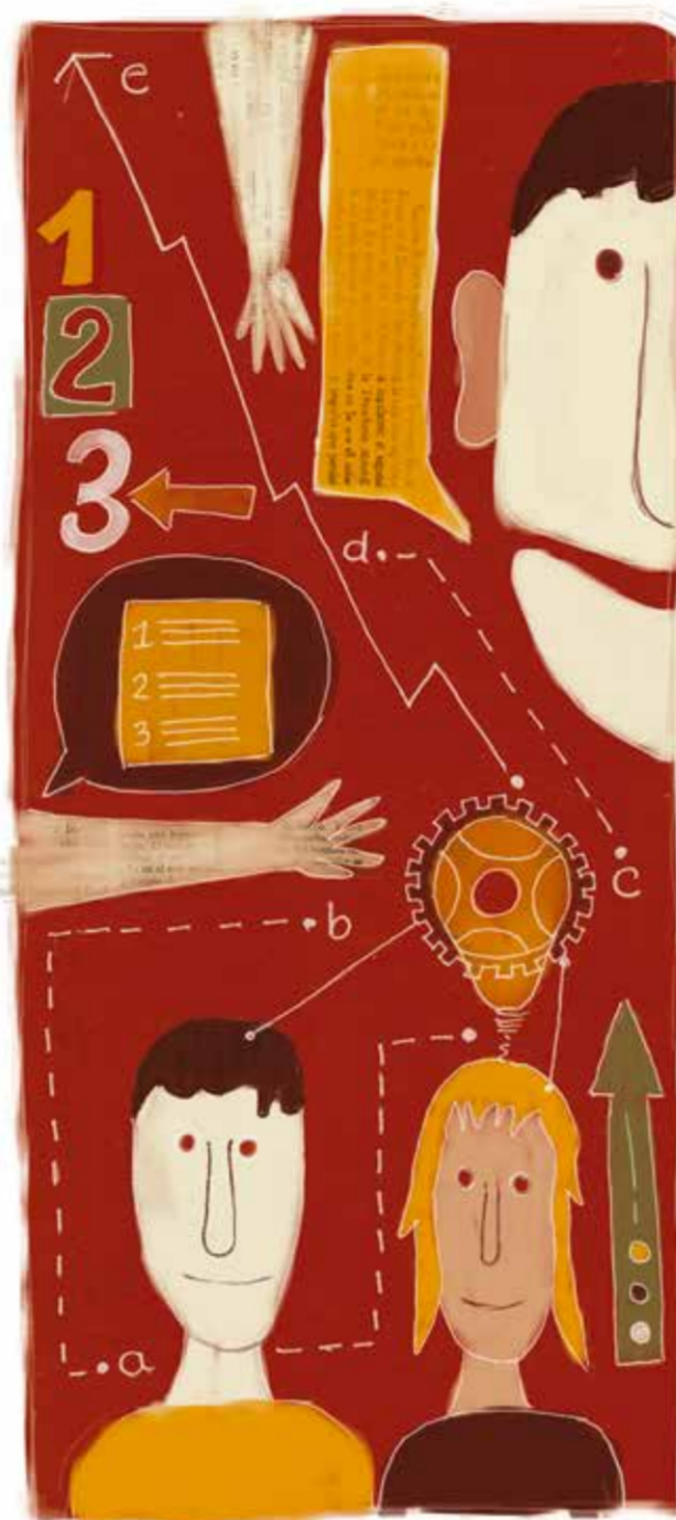
Ilustración Tatiana Martínez Ochoa

calidad, la excelencia y el liderazgo científico, entre otros. Los resultados son positivos para la UPB, ya que subió 13 puestos en el ámbito iberoamericano ocupando la casilla 219, y en el contexto latinoamericano ascendió 12 posiciones logrando el puesto 148. En Colombia, conserva el mismo resultado que el año anterior, lo que le permite mantener el liderazgo en Antioquia como la principal universidad privada en calidad de la producción científica.