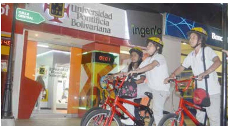
La Universidad Pontificia Bolivariana realizó una actividad lúdica y formativa en Divercity. Allí, niños de diversos colegios de Medellín y algunos ponentes del Foro Mundial de la Bicicleta, vivieron la experiencia de pedalear en una ciudad hecha para los más pequeños. El Campus UPB en Divercity es un espacio creado para que niños, entre los 3 y los 13 años, se acerquen a la investigación e innovación y reconozcan sus capacidades a partir de situaciones cotidianas.

La Universidad Pontificia Bolivariana ha creído en la bicicleta como una opción sostenible en temas de movilidad, como factor incluyente y referente del esfuerzo personal y del bienestar común. La UPB ha pedaleado en torno a encuentros académicos de alcance mundial, reflexiones sobre la incursión de la bicicleta en las dinámicas de ciudad y adecuaciones internas de bicivías y biciparqueaderos. Con la iniciativa del Instituto de Estudios Metropolitanos y Regionales y la Facultad de Diseño Industrial, la Universidad se ha montado en la aventura de la bicicleta.