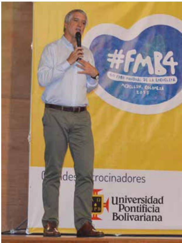
La UPB fue patrocinadora del IV Foro Mundial de la Bicicleta, el cual se realizó en Medellín. Ponentes de carácter nacional e internacional compartieron sus reflexiones y análisis en torno al papel de la bicicleta en la consolidación de alternativas de movilidad ambientalmente amigables. En la foto, el exalcalde de Bogotá, Enrique Peñalosa, quien habló sobre "Bicicletas, igualdad y democracia".