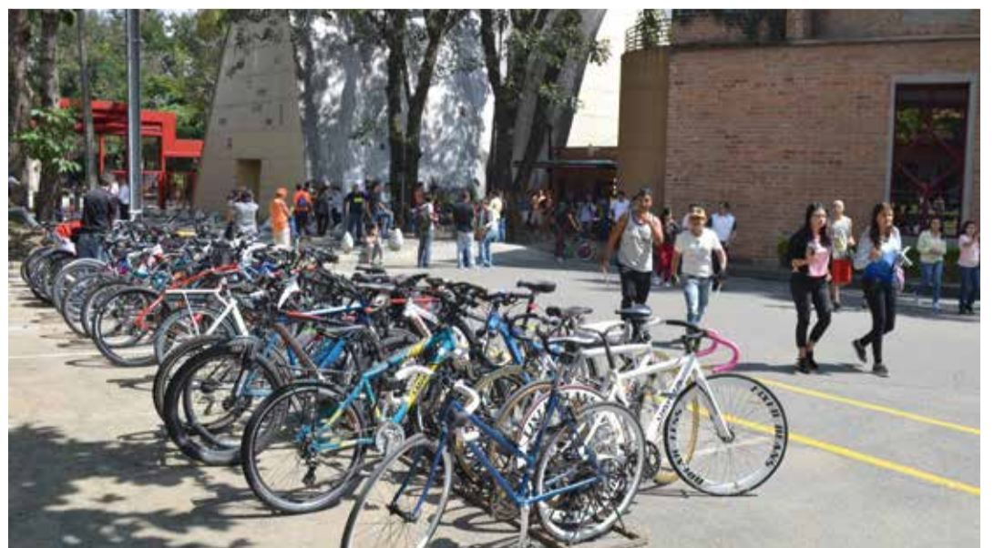
En el marco del Foro Mundial de la Bicicleta, la UPB realizó algunas actividades que sirvieron de antesala a este evento. Conferencias, rifas, carreras lentas, música, ciclo paseos, taller de mecánica de bicicletas hicieron parte de este escenario para pensar, reflexionar y proponer alternativas de movilidad limpia y amigable. La consigna fue "Ciudades para todos".