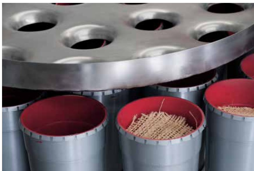
Prototipo de la tecnología, ubicado en el Laboratorio de Biotecnología de la UPB.