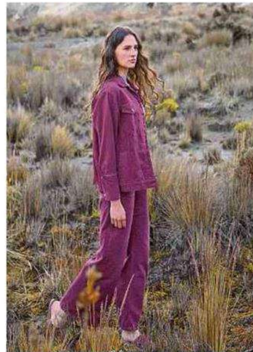
Este es uno de los vestidos de 'La Esencia' de Arkitect.