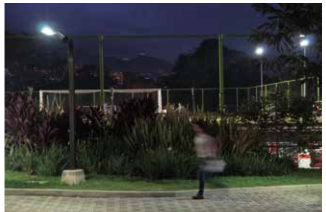
Esta Micro-Red está conformada por 10 subsistemas integrados.

Ya no se trata de una enorme central, como las que conocemos, sino de una red que convierte el entorno en el que funciona, en una ciudad inteligente en miniatura.