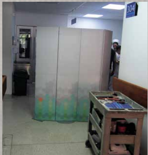
Prueba funcional del prototipo de la barrera en una clínica de la ciudad.

Así mismo, la investigación permitió encontrar nuevas aplicaciones para los productos textiles usados durante