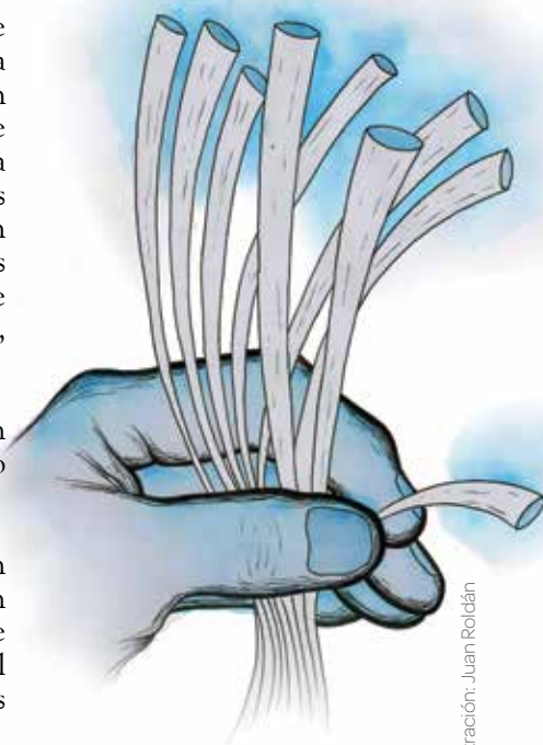
Ilustración: Juan Roldán

1. Towards 2020 - Photonics driving economic growth in Europe. Photonics 21 (abril de 2013).