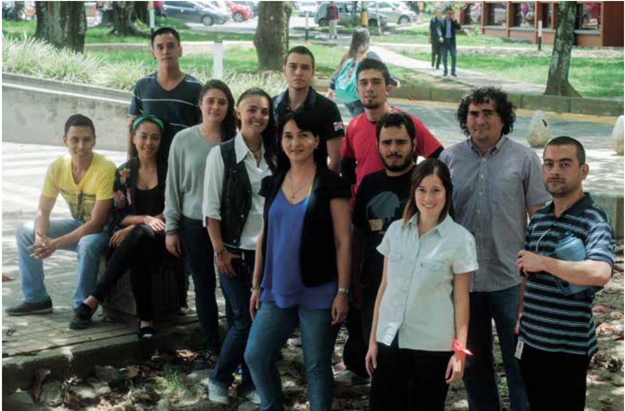
Equipo de investigadores acompañado por estudiantes de las facultades participantes.

La violencia asociada al fútbol no se relaciona solo con armas. También implica la inadecuada utilización del espacio público y el control territorial que algunos actores ejercen en espacios geográficos, en una lógica de amigo-enemigo del contrincante, configuración de identidad colectiva o mal uso de lo público.