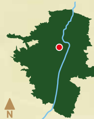
Zona urbana medellín