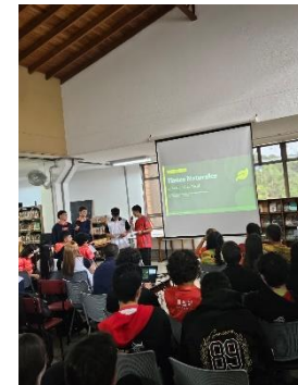
Difusión entre pares.