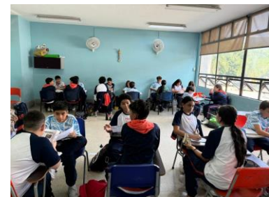
Juego de roles.