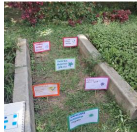
Intervención huerta escolar