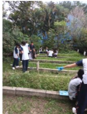
Rastreo y estudio de piso, para siembra.