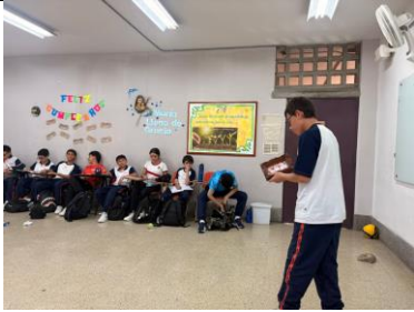
Socialización de experiencias.