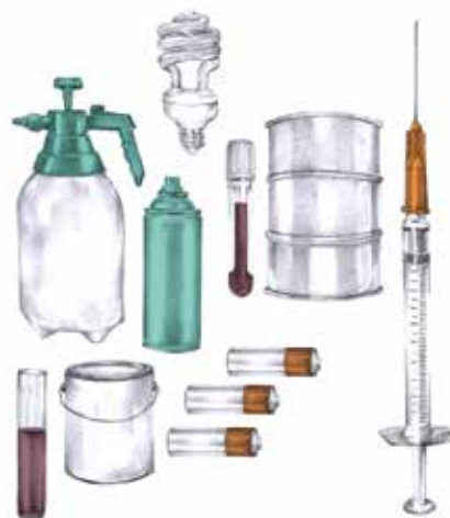
Ilustración: Paulina Ramirez Jaramillo

La literatura de anticipación y el cine moderno hablan de distopías ( Matrix , Elysium , por ejemplo), esos ambientes terribles donde el hombre pierde su hábitat y, en esa pérdida, su humanidad. La ciencia responde a estas visiones trágicas con investigación, acción y enseñanza teniendo como objetivo evitar la distopía. Esto es lo que hacemos en la UPB.