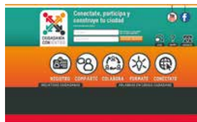
Interfaz de la plataforma web Ciudadanía con sentido.