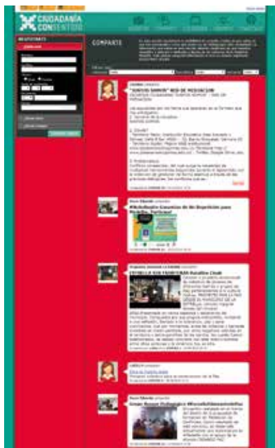
Espacio de participación Comparte, donde los usuarios agregan información de interés para toda la comunidad registrada.

Por ello se recurrió a una metodología que pretendía congregarse en un aula convencional a una comunidad heterogénea (por su edad, formación, estrato socioeconómico, etc.), para convertirla en una comunidad de práctica donde los integrantes pudieran mezclarse y crear redes a partir de un interés común.