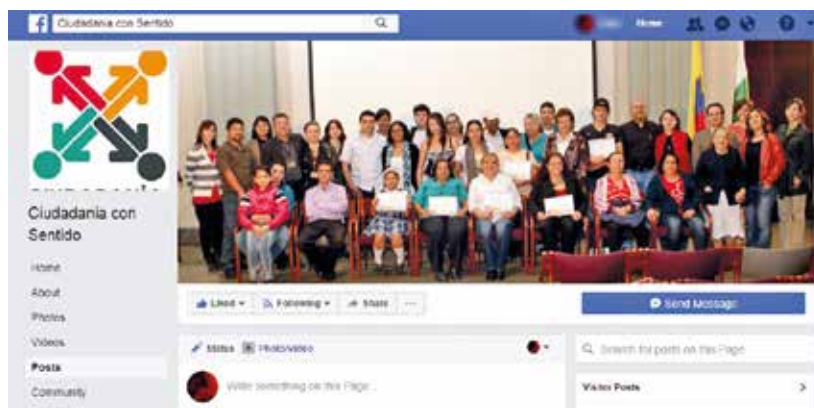
Perfil en Facebook de la plataforma, donde se muestra algunos de los participantes en las comunidades de práctica.

grupo de investigación en los dos momentos anteriores y tuvo en cuenta las condiciones de conectividad. Por esto se pensó su implementación en telecentros, aulas abiertas y conectividad pública, principalmente.